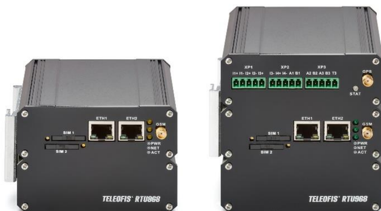
Роутер RTU 2 блока (A, C)

Ключевая особенность роутеров RTU — структура модулей (блоков), позволяющая подобрать оптимальную конфигурацию устройства в соответствии с требованиями и задачами пользователя. Каждый блок имеет свой набор интерфейсов и отвечает за выполнение определенных функций.